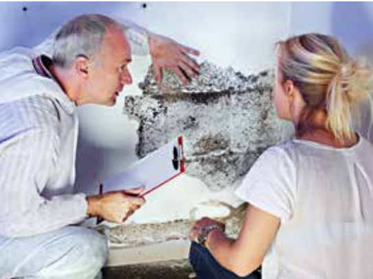
Bei Schimmelbefall hilf oft nur noch der Fachmann.

und eine Reparatur kann das Feuchtigkeitsproblem beheben.“, so Zink. „In vielen Fällen entsteht Schimmel aber durch Unkenntnis oder Unachtsamkeit der Wohnungsbewohner“.